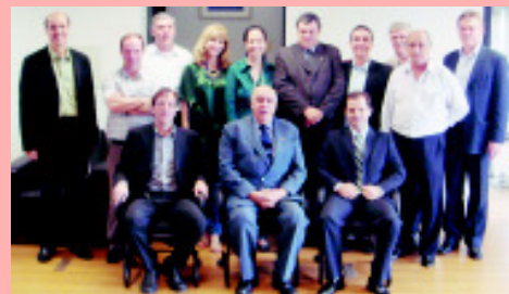
Após pleito, harmonia e combinação de esforços

A nominata da nova diretoria da APROESC pode ser conferida no expediente desta edição, na página dois.